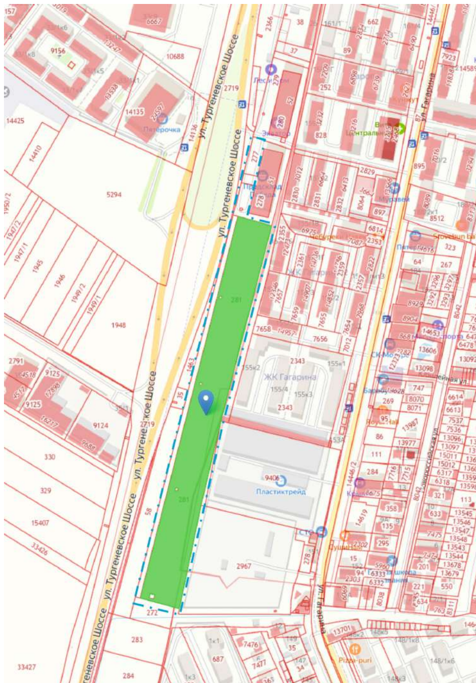
Схема границ проектирования